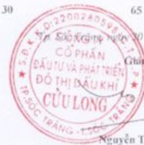
Bùi Thị Kim Ngân